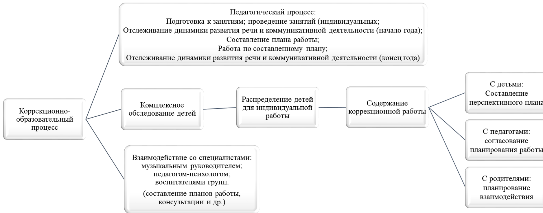
Схема организации работы учителя-логопеда