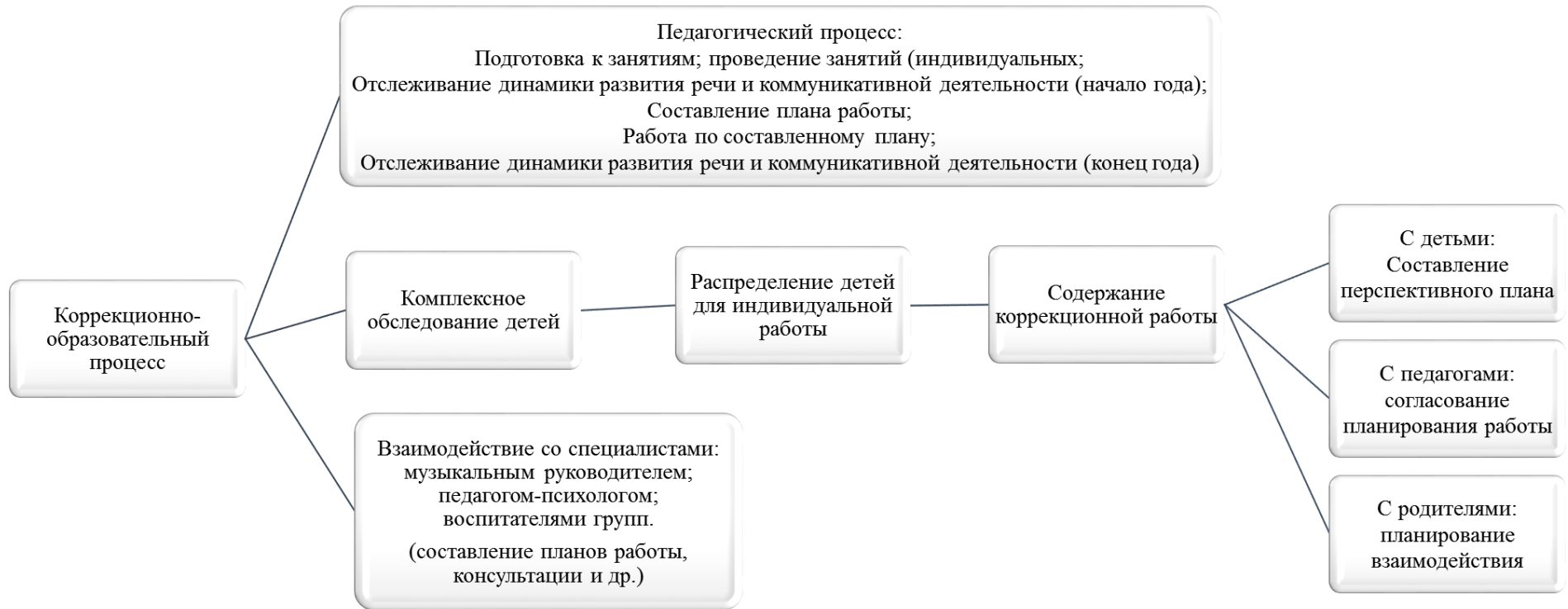
Схема организации работы учителя-логопеда