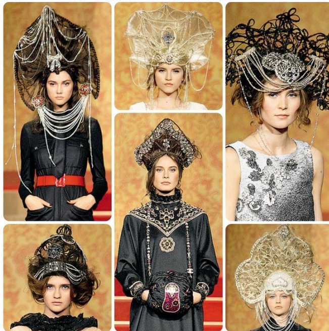
Коллекция Chanel "Paris – Moscou"