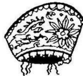
Кокошник. Московская губерния