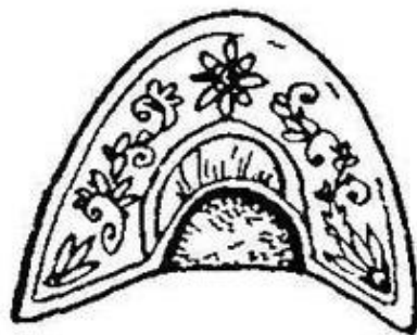
Кокошник. Владимирская губерния