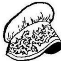
Кокошник. Орловская губерния