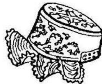
Кокошник. Олонецкая губерния