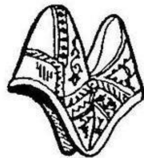
Кокошник. Курская губерния