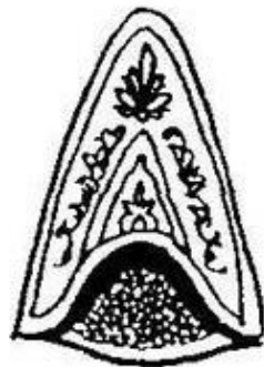
Кокошник. Нижегородская губерния