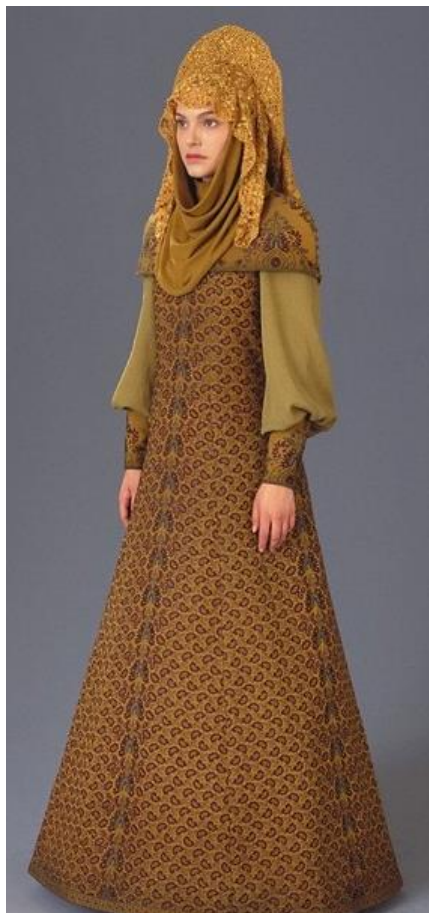
Костюмов королевы Амидалы