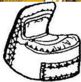
Кокошник. Курская губерния