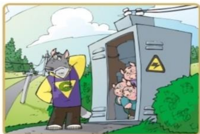
Не лезь на электроустановки и в трансформаторные будки

Опасно для жизни влезать на опоры линий электропередачи, проникать в трансформаторные подстанции или подвалы, где находятся электрические провода