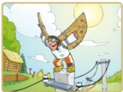
Не лезь на опоры и столбы

Чтобы не подвергать себя риску, запомните простые правила: