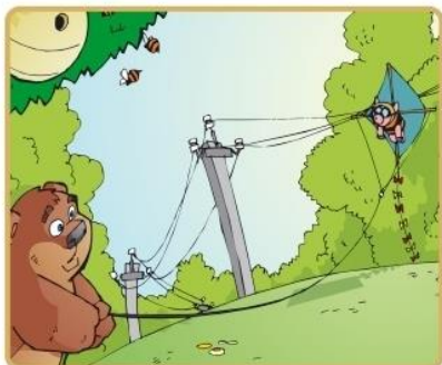
Не бросай ничего на провода и не играй вблизи

Никогда не заходите на территорию и в помещения электросетевых сооружений. Не открывайте двери ограждения электроустановок и не проникайте за ограждения и барьеры. Это может привести к печальным последствиям